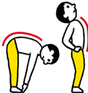
③ 上体を前後に 曲げ伸ばす