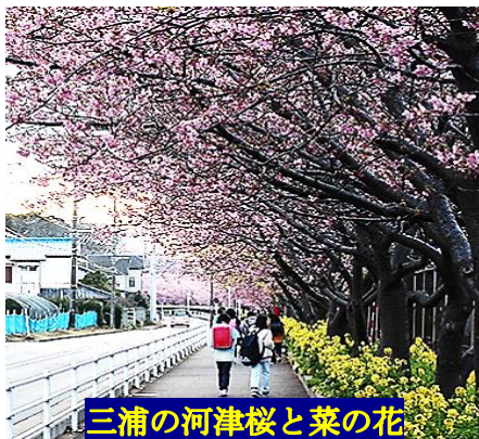
三浦の河津桜と菜の花

三浦半島の歴史を、知れば 知るほど奥が深い！ これからも色々な情報をお届けして参ります