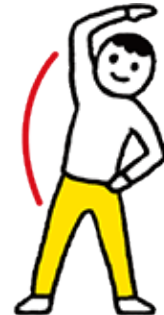
④ 左右のわき腹を伸ばす