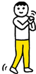
⑦ 手首・足首を回す