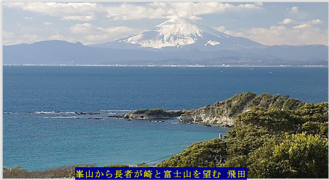
峯山から長者が崎と富士山を望む 飛田