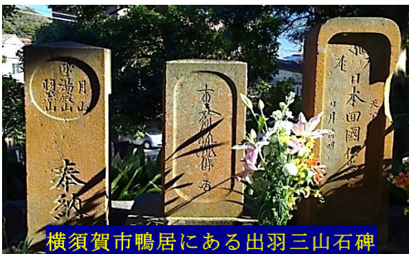
横須賀市鴨居にある出羽三山石碑

三浦半島の歴史を、知れば 知るほど奥が深い！ これからも色々な情報をお届けして参ります