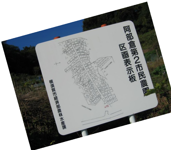
農園の区画表示板